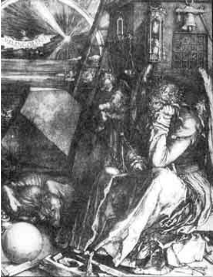
لوحة ا. ألبرشت ديرر، ميلانخوليا ا حفر 1514، جامعة جلاسجو، قاعة هانتريان للفن